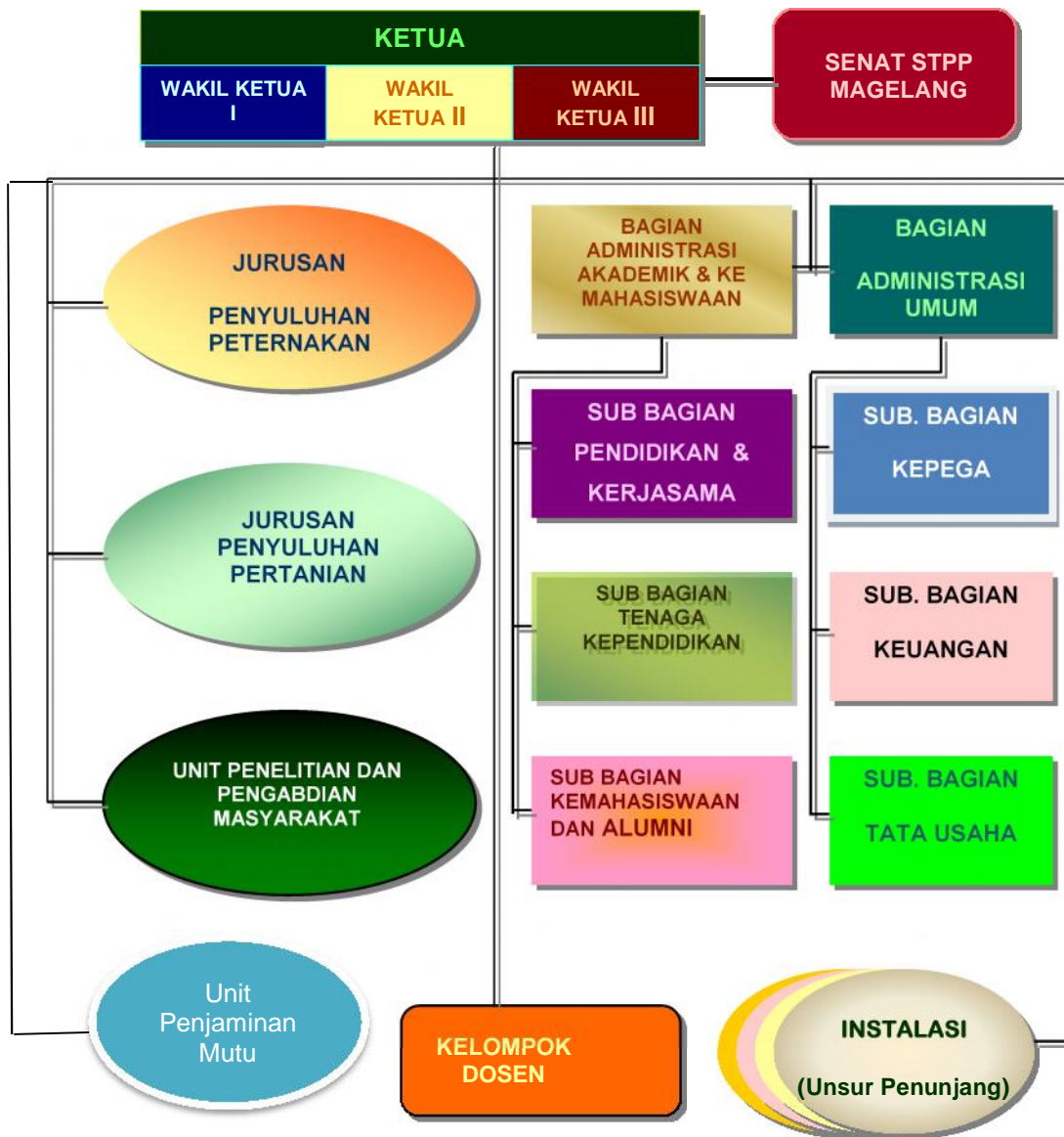
Gambar 1. Struktur Organisasi STPP Magelang