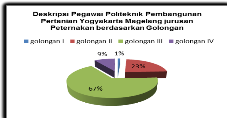
Gambar 3. Deskripsi Pegawai Politeknik Pembangunan Pertanian Yogyakarta Magelang Jurusan Peternakan berdasarkan Golongan