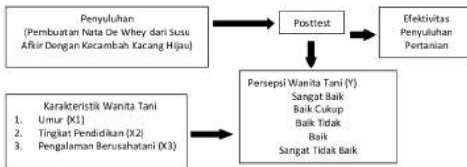
Gambar 1. Skema Kerangka Pikir

Persepsi seseorang terhadap pembuatan nata de whey susu afkir dengan kecambah kacang hijau dipengaruhi oleh faktor eksternal dan internal pelaku persepsi. Di antaranya faktor internal yang diduga mempengaruhi persepsi seseorang adalah umur, tingkat pendidikan serta pengalaman berusahatani. Efektivitas penyuluhan digunakan untuk mengetahui seberapa besar kegiatan penyuluhan berpengaruh terhadap persepsi wanita tani sebagai bagian dari evaluasi penyuluhan pertanian. Efektivitas penyuluhan diukur dalam tiga kategori yaitu <33,3% dinyatakan kurang efektif, 33,3%–66,6% dinyatakan cukup efektif, > 66,6% dinyatakan efektif (Ginting, 1993). Berdasarkan uraian tersebut maka skema kerangka persepsi wanita tani terhadap pembuatan nata de whey susu afkir dengan kecambah kacang hijau adalah sebagai berikut: